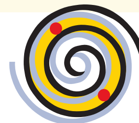
Принципиальная схема спирального блока компрессора ZH с впрыском пара

Спиральный компрессор серии ZH, как и другие спиральные компрессоры Copeland, соответствует всем требованиям высоких стандартов долговечности и надежности. Его возможности включают способность справляться с относительно большим количеством жидкого хладагента, который может повреждать или разрушать механизм привода поршневых компрессоров. Меньше движущихся частей, устойчивый к нагрузкам привод и низкая вибрация, благодаря сбалансированному механизму сжатия, делают спиральный тепловой компрессор ZH самым надежным решением, доступным на рынке тепловых насосов.